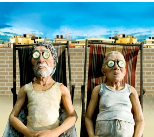
LE SENS DE LA VIE POUR 9.99 $

Une histoire attendrissante à souhait et drôle. Un moment de poésie humaine... improbable ?