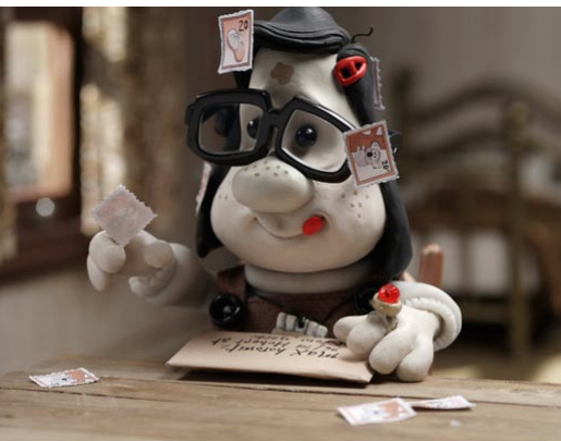
MARY AND MAX

Du long métrage inattendu en salle qui crée la surprise, en passant par un film issu d'un grand studio d'animation japonais qui ravira les fans du genre, ou encore les "courts" de coeur de l'équipe découverts en festivals... Et en bonus, un focus consacré à un pays émergent dans le paysage mondial de l'animation : l'Argentine. Surprises, ravissement et esprit de fête animeront la nuit.