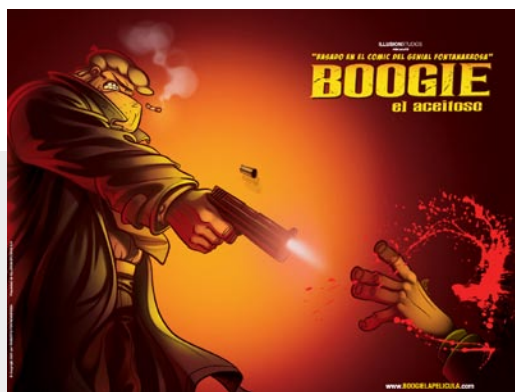
BOOGIE, EL ACBITOSO